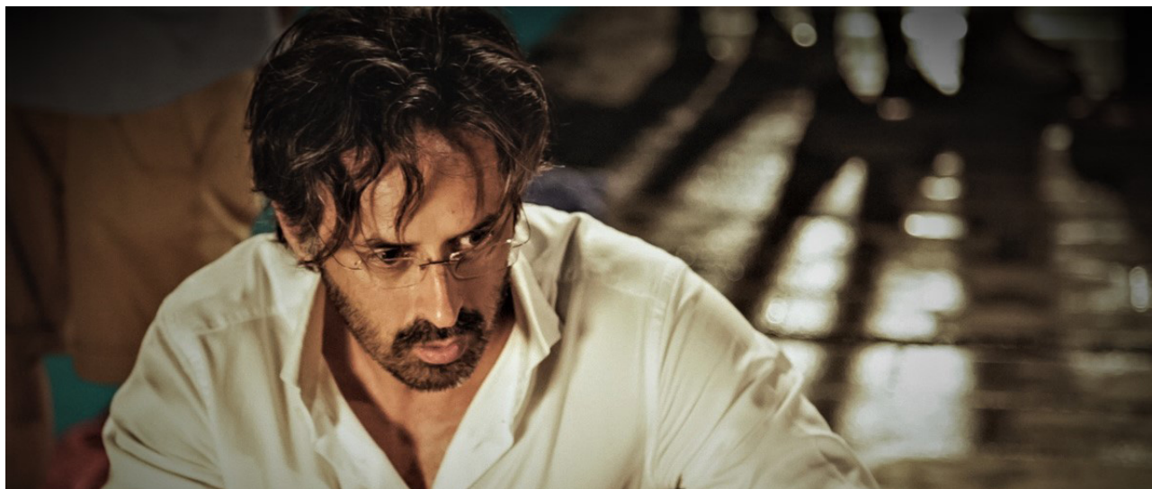
ULISSE LENDARO REGIA

La forza di questo film sta nel suo tema e nei suoi personaggi certo, ma soprattutto nella sua credibilità, nella verità che sprigiona.